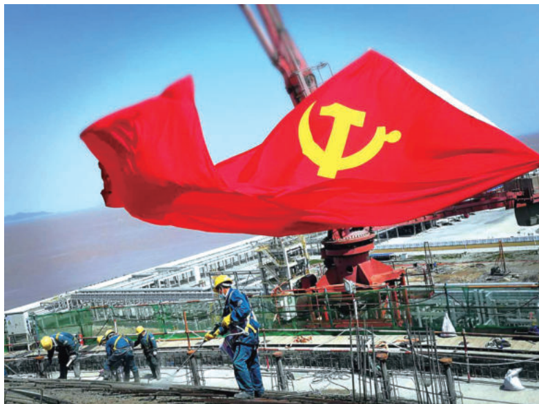
党旗在重点项目一线高高飘扬

司本级和所属二级法人单位全部完成“党建入章”，党的领导成为治理结构有机组成部分；健全完善“双向进入、交叉任职”领导体制，实现党委书记、董事长、法人代表“一肩挑”；建立落实全面从严治党主体责任、“三重一大”决策、党委前置研究讨论“三个清单”，确保党委“把方向、管大局、促落实”领导作用有效发挥。