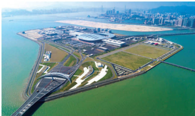
港珠澳大桥珠海口岸人工岛(鲁班奖)

毋庸讳言，当前南通部分企业的确面临发展困境，个别老牌企业生产经营困难，主要问题是房地产