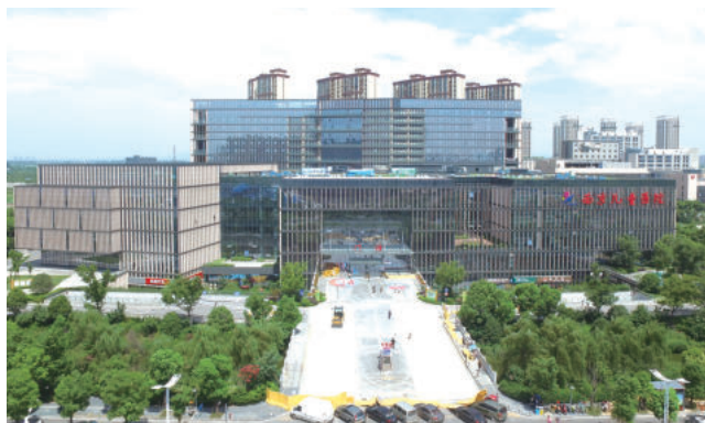
南京河西儿童医院(2017年鲁班奖)

就全国建筑市场而言，尽管受大环境不利和疫情因素的影响，但2022年全国建筑业产值仍达31万亿元，实现同比增长6.5%；全社会固定资产投资57万亿元，同比增长5.1%；房地产开发投资13万亿元，同比下降10%。在南通，目前特级企业25家，占全省三分之一，一级企业408家，建筑业从业人员超过200万。南通建筑业贡献税收总量超百亿，占南通贡献税收总量的14%。17家建筑企业进入江苏省建筑业五十强。85%的业务在南通市外，外向经济蓬勃发