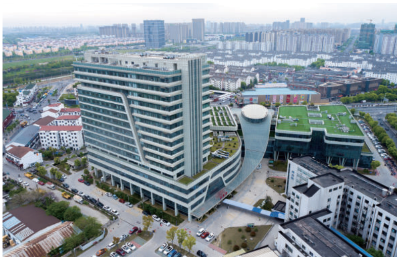
苏州大学附属第二医院高新区医院扩建医疗项目一期(国优)

当前，数字经济已经被列为国家战略，数字经济和实体经济的融合进程必将加速。中央网络安全和信息化委员会发布的《“十四五”国家信息化规划》系统谋划了“十四五”时期数字建设的时间表、路线图、任务书，提出了到2025年数字中国建设取得决定性进展、信息化发展水平大幅跃升、数字经济发展质量效益达到世界领先水平的发展目标。在此背景下，探讨建设行业信息化的转型升级、数字能力的建设提升，很有必要。