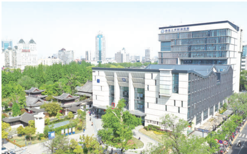
南通大学附属医院新建门诊楼(国优)

建筑企业是传统企业，不可能变成互联网企业，但要运用信息互联技术为管理服务，赋能企业发展，提高生产效率，提高社会生产力。这一点，人们的认识是逐渐转变、逐步提升的。近年来，在建筑企业信息化的实施过程中，信息化建设主导者出现了三种情况：第一种