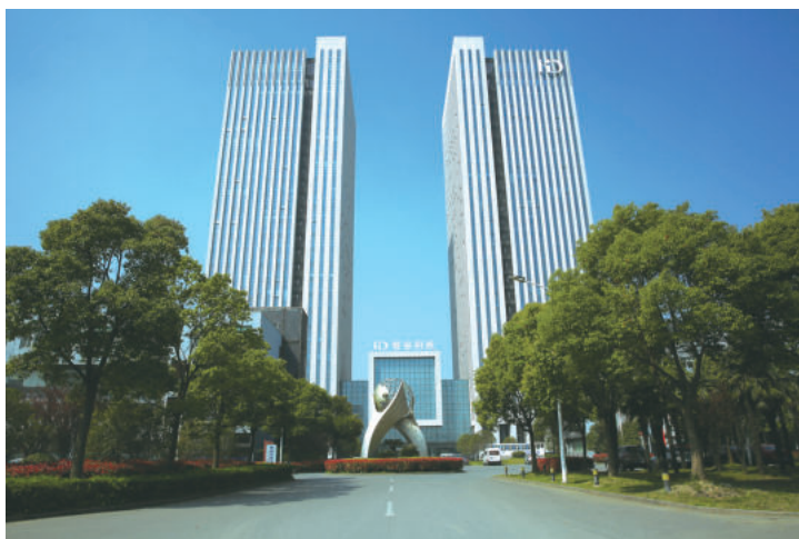
江苏扬州智谷科技综合体(鲁班奖)