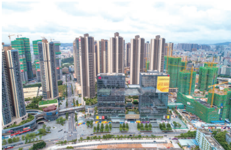
深圳壹成中心花园(鲁班)

三是财务资金风险。投资方资金现状给施工企业带来了巨大风险，房地产推进“三道红线”，各大