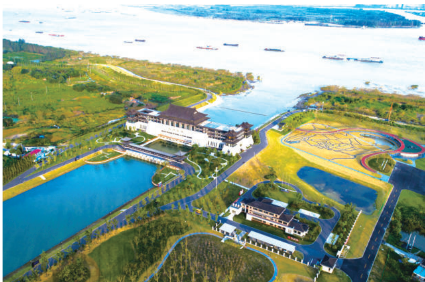
扬州市瓜洲泵站工程(鲁班奖)