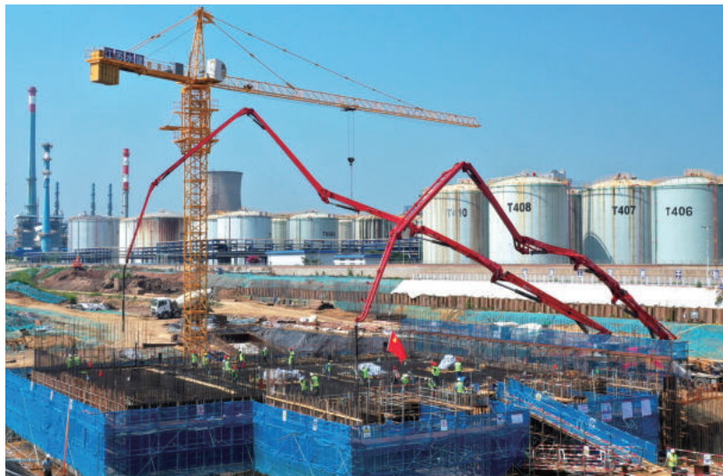
新桃花港工程(党旗在一线工地飘扬)