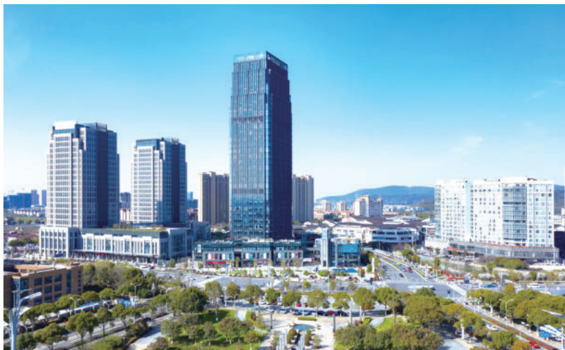
绿景·NEO(苏地2007-G-22号地块)项目(国优)

企业的数字化建设要实事求是、量身定制。因为每家企业都有各自的特点和需求，比如企业战略不同、管理策略不同、人员结构不同、企业规模与管理成熟度不同、企业文化不同，甚至每位管理者的管理