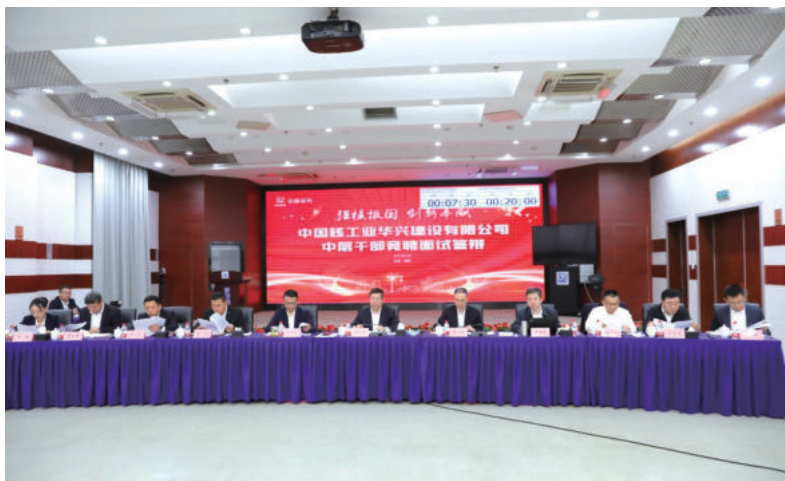
大力推进干部队伍年轻化

全面推进“党建+安全”双责任区、“党建+科技创新”、“党建+促重大专项”等“党建+”工程，在“一带一路”建设、长三角一体化发展等国家重大战略中，在田湾核电7/8机组、霞浦示范快堆项目等重大工程中，200余支党员突击队、党员志愿服务队听党指挥、闻令而动，2941余名党员冲锋在前，有力担当。在抗击新冠疫情斗争中，公司组织成立抗疫突击队、志愿服务队476支，累计11848人次参与疫情防控1943次，参与上海、深圳、西安、福建等地疫情防控志愿服务、方舱医院建设，坚