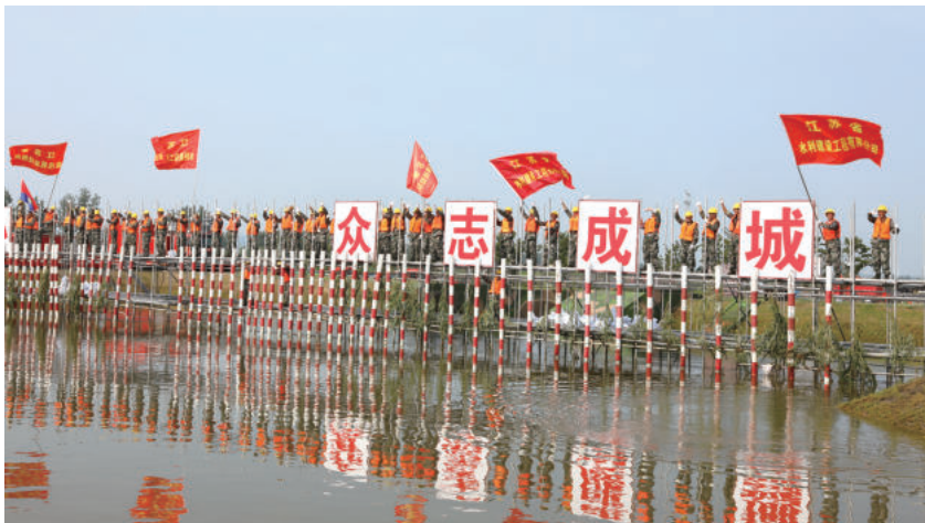
江苏省防汛应急抢险骨干力量

企业的快速发展，离不开党组织的坚强领导。公司党委在江苏省水利行业党委的正确领导下，坚持把党的领导融入公司治理的各个环节，将党的建设作为