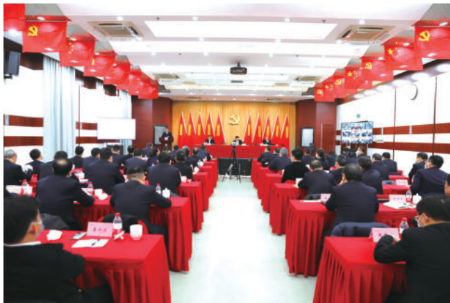
公司召开党风廉政建设和反腐败工作会

中核华兴坚持一体推进不敢腐、不能腐、不想腐，始终保持高压态势，强化不敢腐的震慑，持之以恒落实中央八项规定精神，加大对工程建设、招标采购、违规经商办企业等领域违纪违规问题查处力度。着力标本兼治，构建不能腐的体制机制，坚持运用“四种形态”，深化推进“靠企吃企”“境外腐败”“影子股东”等专项整治工作，加大政治巡察力度，深入探索分领域、分层级专项巡察，抓好巡察发现问题整改，巡察利剑作用有效发挥。深化廉洁教育，筑牢不想腐的思想堤坝，通过廉洁约谈、干部任前谈话、关