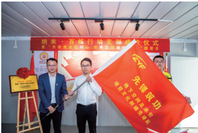
中亿丰地下空间项目部创建“百炼”行动支部

管理的整体逻辑，旨在引导项目部跨出管理升级的第一步，为的是让项目管理者从习以为常的稳态中惊醒，激发项目部的主观能动性和活力。“项目策划”就是模板和工具，无论这份模板最终变成OGSM-T，还是别的管理工具，万变不离其宗，都要围绕项目管理三件大事：服务好客户（客户满意）、做好项目（完美履约）和建好工程（效益最大化）。理解这一点后，就能明白“1”和“5”的关系，施工策划、商务策划、财税策划、科技策划、党建及项目文化建设策划之间并非彼此割裂，而是相互依存，彼此协同的。基于此，解题的关键，就是项目管理者必须抛弃“单一项目的负责人”这一传统观念，纵观团队培育、品牌营销、成本管控等方方面面，用“上帝视角”深入剖析项目管理。而在此过程中，也会自然而然找到项目文化和生产运营的契合点，创作出属于某一部独具特色的“文化气候”。