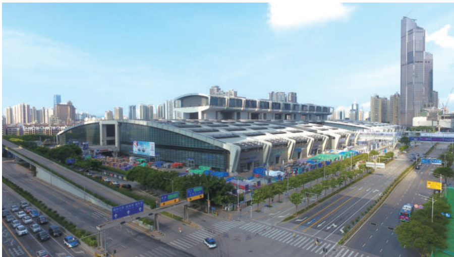
深圳玛丝菲尔总部中心

匠心传承是企业发展最为可贵的精神元素。江苏华建在40年发展中传承、沉淀出的优秀品质，滋润着华建人的初心，也鞭策、激励着年轻同志的成长。站在江苏华建成立40周年的新起点上，在党的二十大精神指引下，华建人将继续传承和发扬老一辈华建人可贵的精神品质，将“精益求精、追求卓越、