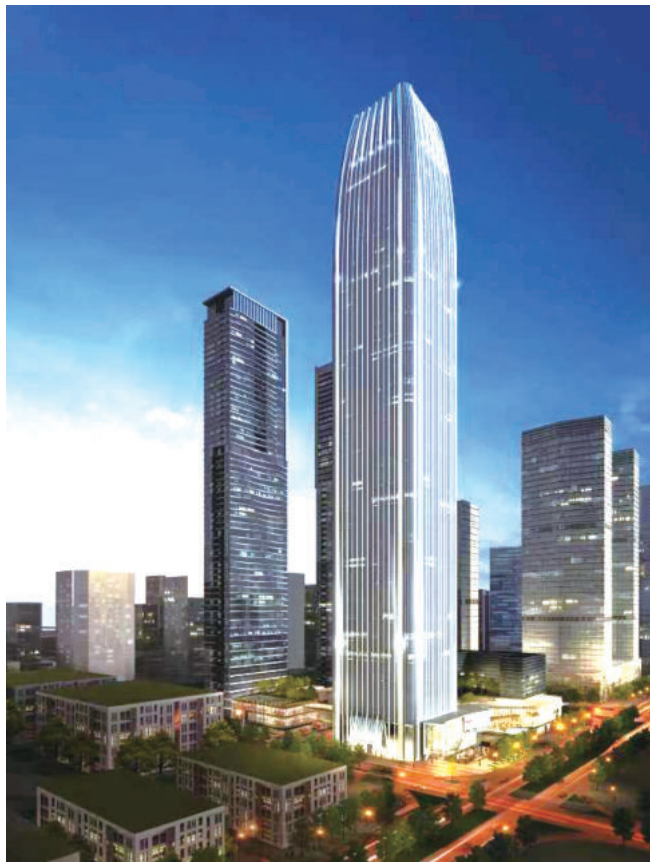
深圳恒裕金融中心(江建集团承建)

龙舞京华，江都铁军进京赶考，施工队伍由六七百人发展到15000人，拥有13个分公司，连续十年被评为优秀施工企业，勇夺进京施工企业评比第一名。