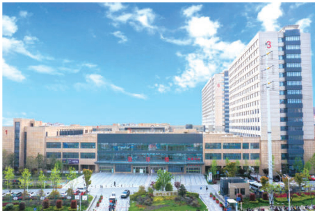
海门市人民医院新院急诊医技住院办公楼(国优)

(三) 强化资质管理，优化审批流程。一是根据建设工程质量检测活动的实践需要，将检测机构资质修改为综合类资质和专项类资质。二是落实“放管服”改革要求，不再要求检测机构提供营业执照、技术人员职称证书及社会保险等书面材料，改由资质许