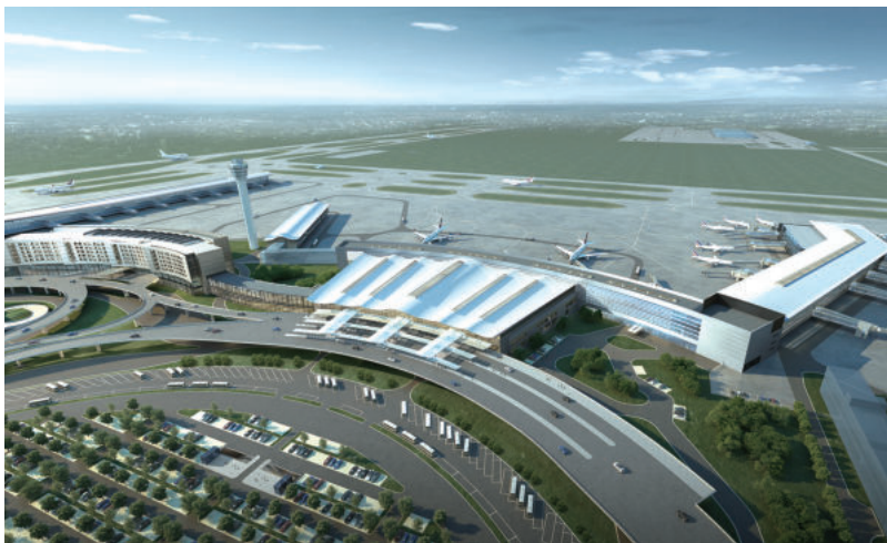
南京禄口国际机场 T1 航站楼改扩建(国优)

基于项目履约实施的全过程和全要素,本阶段在市场开发阶段的风险也会集中暴露,为了简化分析过程,从三个结果是否符合预期去分析项目实施中的潜在风险点,一是项目是否按时交付;二是项目是否达成交付标准;三是项目是否有利可图。