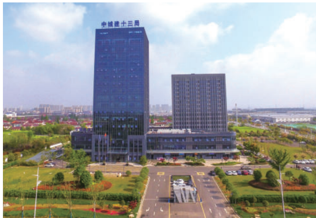
中城建第十三工程局总部大楼(国优)

一是强化组织领导。要高度重视建设工程质量检测工作，进一步提高政治站位，健全工作机制，做好制度衔接，确保检测市场平稳有序，保障建设工程质量安全。