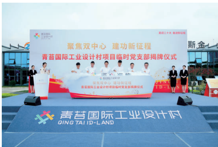
青苔国际工业设计村项目成立临时党支部

作为中亿丰最主要且最基础的单元个体——项目部，其承载的使命艰巨且厚重，既是企业数据指标的基本来源，也是企业改革的重要实践场，人才培育、两化建设、科技创新、文化引领……项目部永远是那