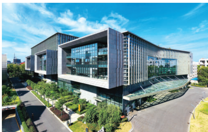
江苏省政务服务中心及公共资源交易中心项目二期工程 (鲁班奖)

平。围绕项目现场的人、财、料、机等核心要素，建立项目管理平台。整合大地测绘系统、BIM技术、北斗定位系统，利用物联网技术、无线传输手段，建立起数据共享和交互平台，实现数字建造。通过机械设备管理软件、安装在机械上的智能监控芯片、视频监控设备，对设备使用过程实时动态监控，建立预警值管理，保证设备的安全运行始终处于可控状态。引入AI、特征识别和云计算等技术，实现智慧化施工。2022年公司与华为公司合作，通过智慧镜头等技术和设备，有效提高了项目现场管理水平。