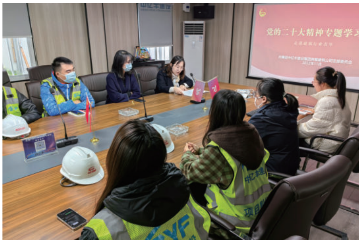
苏地2021-WG-28号商办地块项目： 党的二十大精神专题学习会