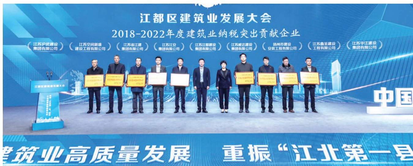
2023年1月30日江都召开建筑业发展大会，表彰一批先进集体和个人

“五天一层楼，施工速度之快，工程质量之好，赶上了世界建筑业的先进水平。”《人民日报》《红