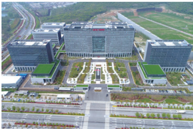
仙林新所区建设项目A地块土建安装工程 施工总承包A1及地下室(国优)

建筑工程质量事关人民生命财产安全，事关城市未来和传承，事关新型城镇化发展水平。党的十八大以来，以习近平同志为核心的党中央高度重视建筑工程质量工作，始终坚持以人民为中心，部署建设质量强国，特别是党的二十大提出“增进民生福祉，提高人民生活品质”的任务要求，不断增强人民群众获得感、幸福感、安全感。