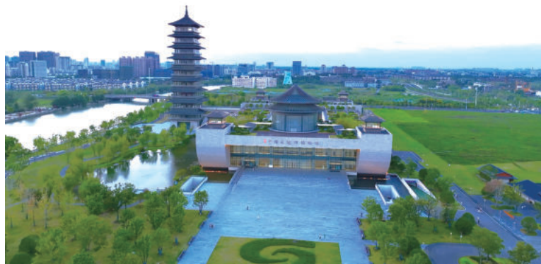
扬州中国大运河博物馆

邗建的50年，是科技创新、奋发图强的50年。面对产业结构和外部形势的深刻变化，江苏邗建集团客观把握建筑业发展的规律，清醒掌控企业运营实情，开始在更大舞台开创紧密型事业，并变革发展方式，在市场上扮演投资商、开发商、承包商、制造商、供应商、建材商、贸易商等多重角色。近年来，江苏邗建集团上下以建设“美丽中国”为使命，以“五大”发展理念为指引，积极发挥产业研究、规划设计、科技研发、投资建设、运营服务的一体化协同优势，深入实施“一体化经营、信息化管理、工厂化