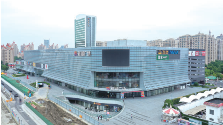
明珠城丹桂苑15#地块商业体(国优)

数字孪生是对物理对象进行实时数字化表示的概念，通过先进的建模与仿真工具，实现对项目成本、