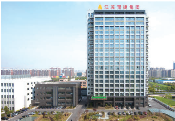
江苏邗建集团总部大楼

邗建的50年，是艰苦创业、不懈奋斗的50年。近年来，江苏邗建集团党委一直将党建工作作为企业经营管理的重点，解放思想，开拓创新，“红旗飘扬在一线”，充分发挥党组织的战斗堡垒和党员先锋模范作用，团结带领广大职工奋力拼搏，实现了各项事业的快速、健康、全面发展。