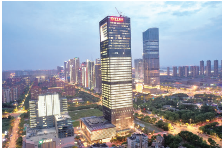
招商银行南京分行招银大厦(国优)

五是供应链管理风险。对施工企业而言，供应链重点是对物资和分包的采购管理。项目物资一般占项目总成本的50%~60%，由于涉及的资金量巨大，最容易滋生“暗箱操作”、弄虚作假、以次充好、收受回扣等风险，也最容易“跑、冒、滴、漏”，积压浪费，因此，大型施工企业积极推进集中