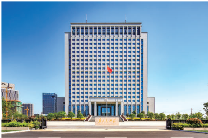
泰州市公安局(鲁班奖)

融入信息技术打造智慧管理平台，积极推动产业数字化转型，锚定“十四五”发展目标，江苏邗建集团坚定“躬身入局”的勇气与信心，大步走好高质量发展之路。集团通过BIM技术+智慧工地+BIM信息化管理提高项目的综合管理水平，综合数字化智慧工地平台、项目物资综合管理系统、项目综合管理系统、移动互联网+工程项目管理系统、“云上项目”管理系统、员工（劳务）实名制系统、环境（扬尘）监测系统、安全动态管理系统等项目管理信息化工具的使用，有效实现了项目的高质量管理。近3年来，集团已安装智慧工地系统超300个。承建的南京青少年宫数字化智慧工地项目以高