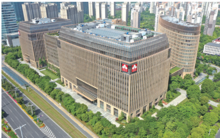
华泰证券广场工程1号楼及1号连廊(国优)

三是项目承接风险。从微观来看，具体到每个项目承接，也都面临多方面的风险，对此，很多企业制定了明确的项目承接标准，一