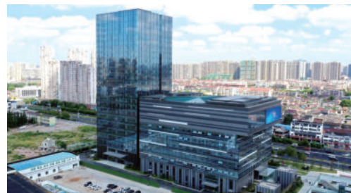
JIANGSU CONSTRUCTION INDUSTRY