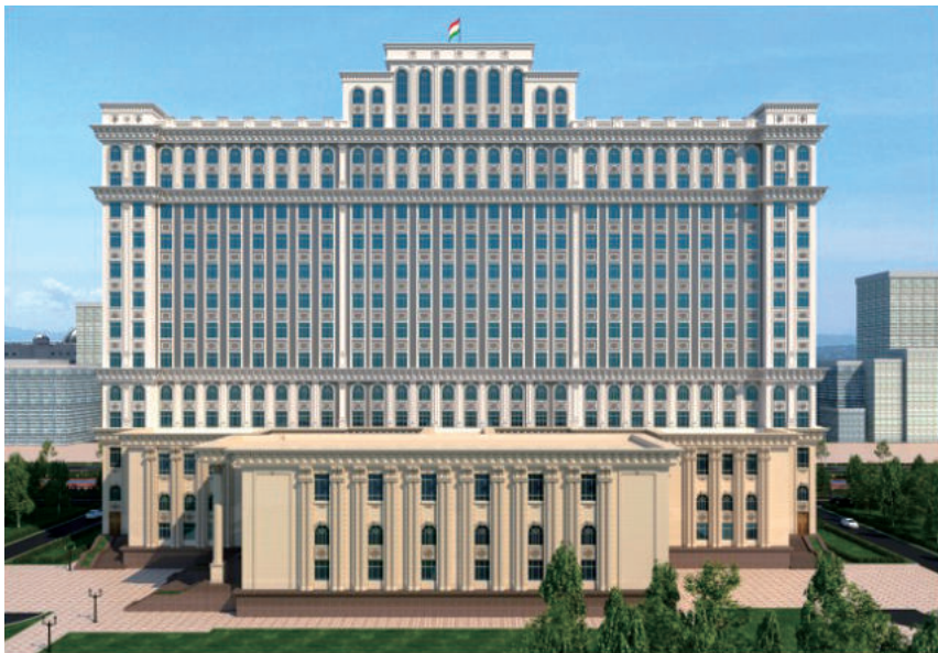
塔吉克斯坦政府大楼(江都建设承建)

创新架云梯，人才是基础。全区建筑企业设立省级博士后创新实践基地3家、研究生工作站2家、技