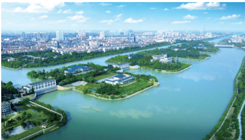
江都水利枢纽工程(江水北调龙头工程,南水北调东线的渠首和源头)

素有水乡之称的江苏，湖泊港汊密布，长江、淮河横穿东西，古老运河纵贯南北。作为全国闻名的水利大省，在江苏治水发展的历程中，始终活跃着一支有着70年光荣历史的治水铁军——江苏水建。